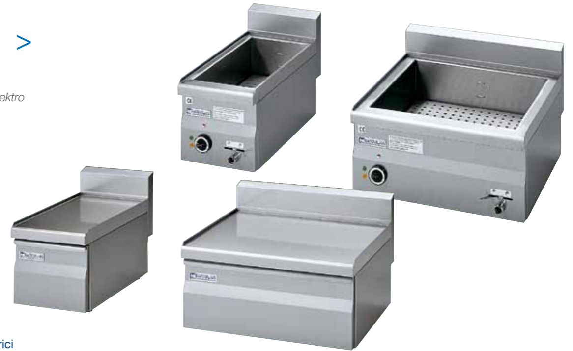
▼ Friggitrici a gas o elettrici Gas or electric fryers Friteuses à gaz ou électriques Fritteusen Gas oder Elektro Freidoras a gas o eléctricas