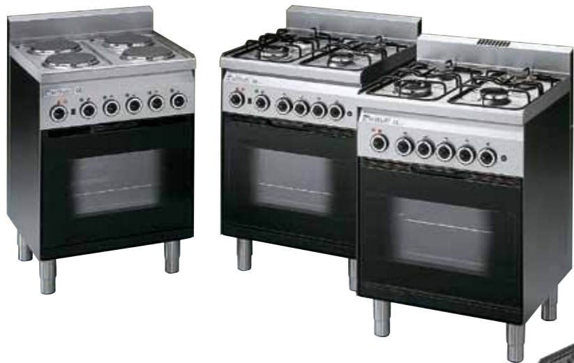
< Cucine gas o elettriche Electric or gas cookers ElektroCuisinières à gaz ou électriques Herde Gas oder Cocinas gas o eléctricas