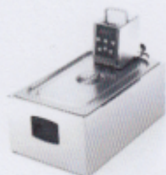
Vasca inox con coperchio opzionale